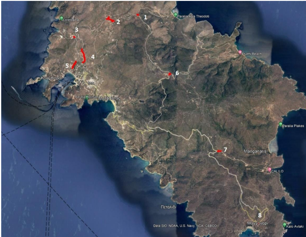
Εικόνα 1 Αποτύπωση περιοχής παρέμβασης

Και στις δύο περιπτώσεις η τοποθέτηση του φωτισμού προτείνεται σε θέσεις που δεν συνδέονται με εμπορικές χρήσεις ή χρήσεις αναψυχής. Αντιθέτως, όπως φαίνεται και στον σχετικό χάρτη, οι θέσεις έχουν επιλεγεί λαμβάνοντας υπόψη την επικινδυνότητα του κάθε σημείου. Πρόκειται για ένα έργο που απολύτως σύμφωνο με τις απαιτήσεις της Πρόσκλησης. Σε καμία από τις προτεινόμενες θέσεις δεν υπάρχει δίκτυο οδοφωτισμού.